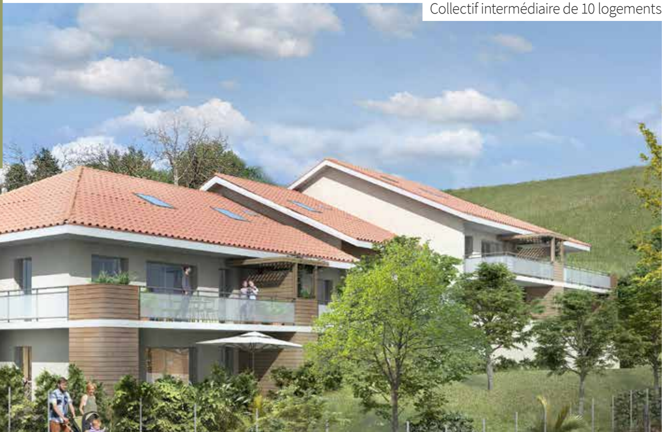
Collectif intermédiaire de 10 logements