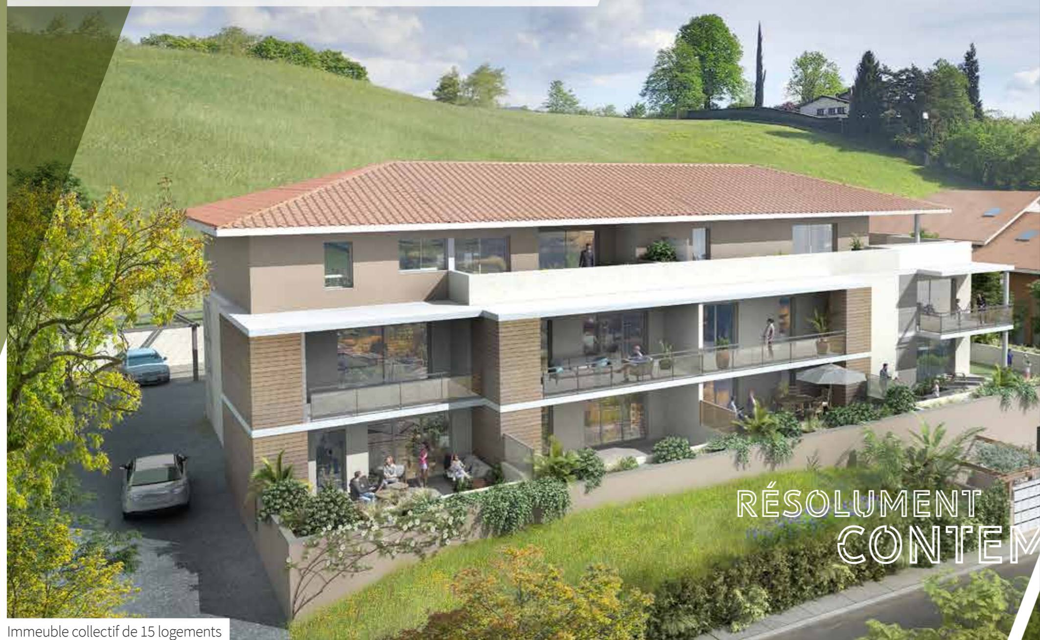
Immeuble collectif de 15 logements

À Saint-Marcellin, le Clos Arthur est idéalement situé à 500 m du centre-ville. Un emplacement de choix pour qui recherche un lieu de résidence au calme. À proximité de toutes les commodités, dans une ville réputée pour sa riche histoire.